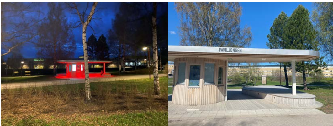
Bild 6a-b. Delningspaviljongen dag- och kvällstid.

sammankomster men har också fungerat som till exempel lokal för utdelning av campuskort till nya studenter. Paviljongen har också använts vid utomhusträning. På utsidan av delningspaviljongen finns en större yta under tak med sittplatser och laddningsmöjligheter (bild 6a-b). Den stora takbeklädda altanen gör platsen optimal för att hålla möten utomhus och fungerar bra för en större ansamling deltagare. Paviljongen är försedd med informationsskärmar (eg. projektion på dess fönsterrutor) och kommer även under 2021 att förseas med en utomhusskärm för delning av presentationer och mötesdokument. Delningspaviljongen har en liten inomhusyta med vatten, värme och kylskåp. Av säkerhetsskäl är fönstren på den utrustade med en insynskyddande film. Utebelysningen i taket lyser när det är mörkt ute för att bidra till ett tryggare campus. Wi-fi finns vid paviljongen. Målsättningen är att delningspaviljongen ska vara den naturliga mötespunkten för de som vistas i och runt om universitetsstaden.