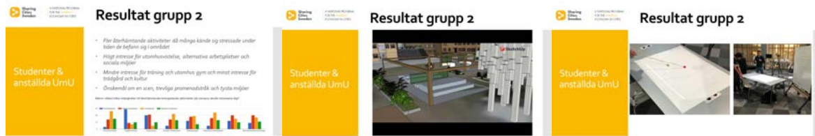
Bild 3a-c. Resultat Studenter och yrkesverksamma