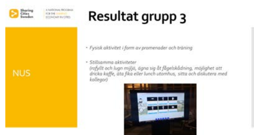
Bild 4. Resultat Besökare

I samverkan med Designhögskolan vid Umeå universitet genomfördes ett annat studentprojekt där studenterna fick i uppgift att på ett tilltalande sätt skapa information om olika platser och deras kopplingar till hållbarhet (de globala hållbarhetsmålen). Resultatet från den student som fick i uppgift att föreslå en information om delningspaviljongen och campusparken grönytor visas i bild 5.