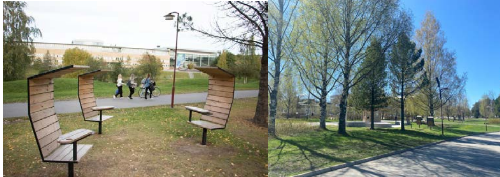
Bild 7a-b. Delbara arbetsytor i campusparken. I bild 7b syns även den flödessensor som är fäst på en lyktstolpe och som registrerar aktivitet.

efter egna preferenser gällande exempelvis solljus och vind. Stolarna är konstruerade med hållbarhet i åtanke, av värmebehandlat furu från svenska skogar och i svenskt återvunnet stål. Satsningen är också unik i norra Sverige där det är de första utearbetsplatserna som byggs i kallt klimat.