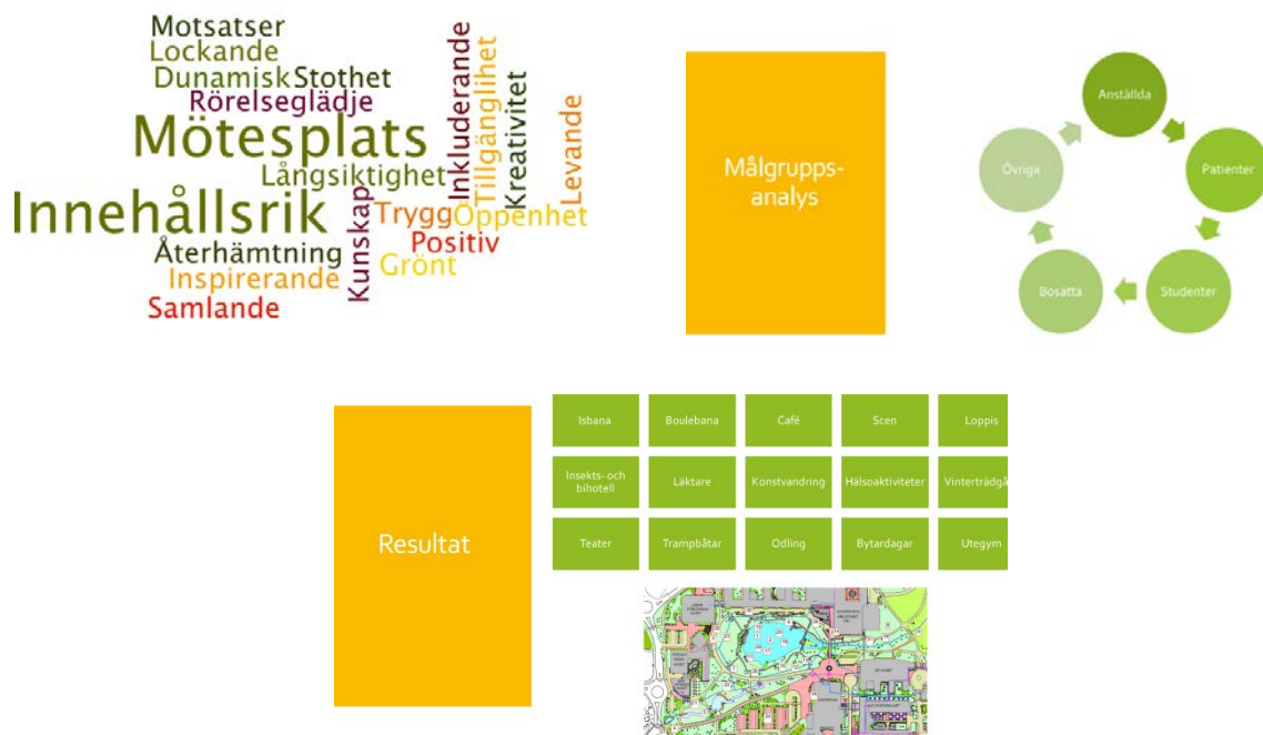
Bild 1a-c. 1a. Resultat vision, 1b. Resultat målgruppsanalys och 1c. Resultat aktiviteter.