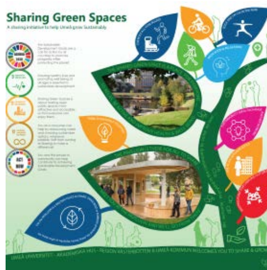
Bild 5. Designstudents förslag på information. Studentens upphovsrätt.

I samverkan med Designhögskolan vid Umeå universitet genomfördes ett annat studentprojekt där studenterna fick i uppgift att på ett tilltalande sätt skapa information om olika platser och deras kopplingar till hållbarhet (de globala hållbarhetsmålen). Resultatet från den student som fick i uppgift att föreslå en information om delningspaviljongen och campusparken grönytor visas i bild 5.