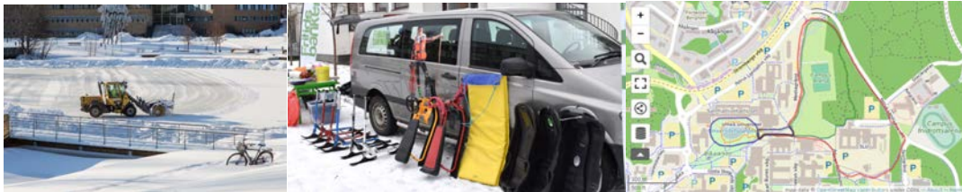
Bild 8-c. Illustration av delningstjänster i form av aktiviteter i campusparken.