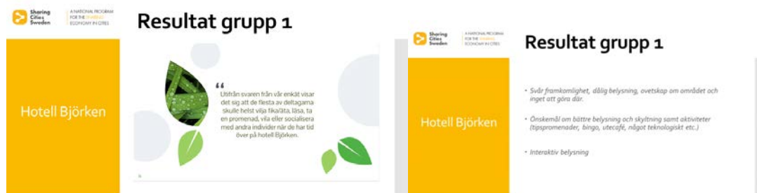
Bild 2a-b. Resultat Patienter

Under vintern 2018/2019 fick tre olika studentgrupper med studenter från utbildningsprogram i datavetenskap och arbetsterapi genomföra projektarbeten med syftet att utveckla målgruppsanpassade och interaktiva aktiviteter för tre av projektets målgrupper: patienter, studenter och yrkesverksamma på universitetet samt yrkesverksamma och besökare på sjukhuset. I varje grupp deltog både arbetsterapeuter och datavetare, dock med olika infallsvinklar för att lösa det gemensamma problemet. Resultatet av projektarbetena presenteras kan sammanfattas: grupp 1 – önskvärda aktiviteter för patienter är möjligheter till mer stillsam rekreation som promenad och fika, grupp 2 – önskvärda aktiviteter för studenter och yrkesverksamma är både möjligheter till stillsamma aktiviteter och utearbetsplatser samt grupp 3 – önskvärda aktiviteter för besökare och sjukhusanställda är både fysiska och mer stillsamma aktiviteter (bild 2 a-b, 3 a-c och 4).