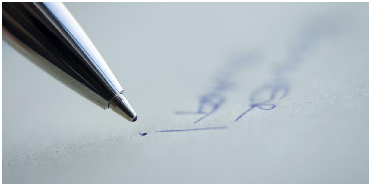
Köper du något av en annan privatperson gäller köplagen, som går att avtalas bort.

Eller rättare sagt, skriver ni som parter ett avtal är det detta som gäller, vilket innebär att du kan påverka innehållet. Hyr, delar eller lånar du en vara av en annan privatperson eller plattform gäller köplagen inte alls och det lagliga skyddet för båda parter blir i princip obefintligt. Händer det sedan något och ni inte är överens är det domstol som gäller.